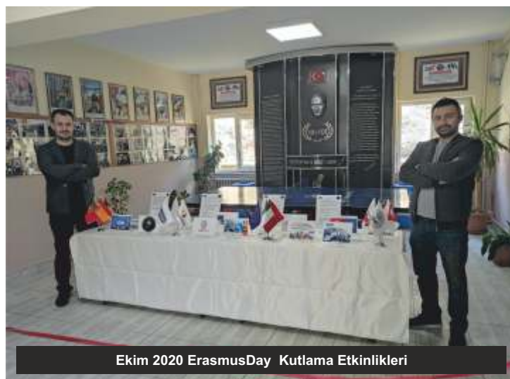
Ekim 2020 ErasmusDay Kutlama Etkinlikleri