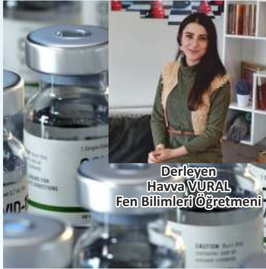
Derleyen Havva VURAL Fen Bilimleri Öğretmeni

1 Aralık 2019 tarihinde Çin'in Hubei bölgesinin başkenti olan Vuhan'da ortaya çıkan Corona Virüs ile dünya hala mücadele etmekte. Bu salgından bir an önce kurtulmak için bilim insanları çeşitli aşılara çalışmaya çalışmakta. Aşı çalışmalarında yüzü güldüren ve koronavirüs aşısında başarıya ulaştığını açıklayan ilk şirketin arkasında Türkiye kökenli iki bilim insanı var; Uğur ŞAHİN ve Özlem TÜRECI.