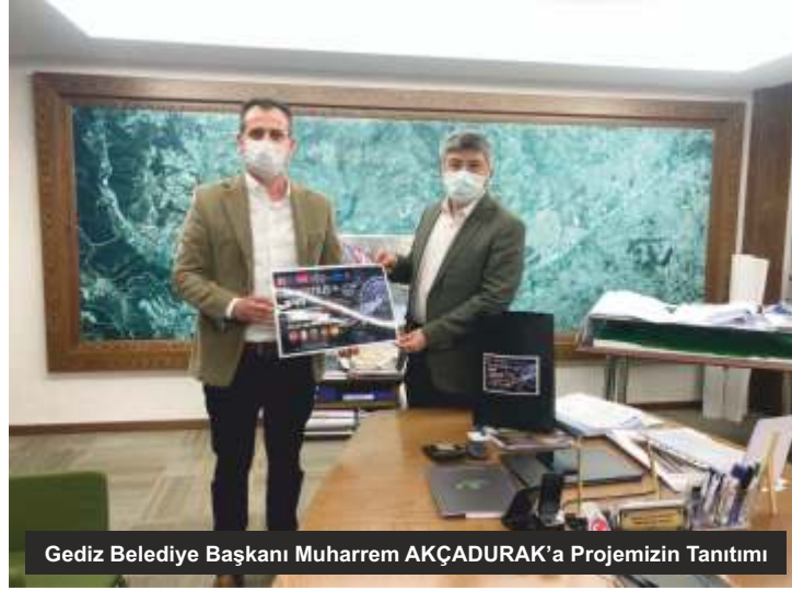
Gediz Belediye Başkanı Muharrem AKÇADURAK'a Projemizin Tanıtımı