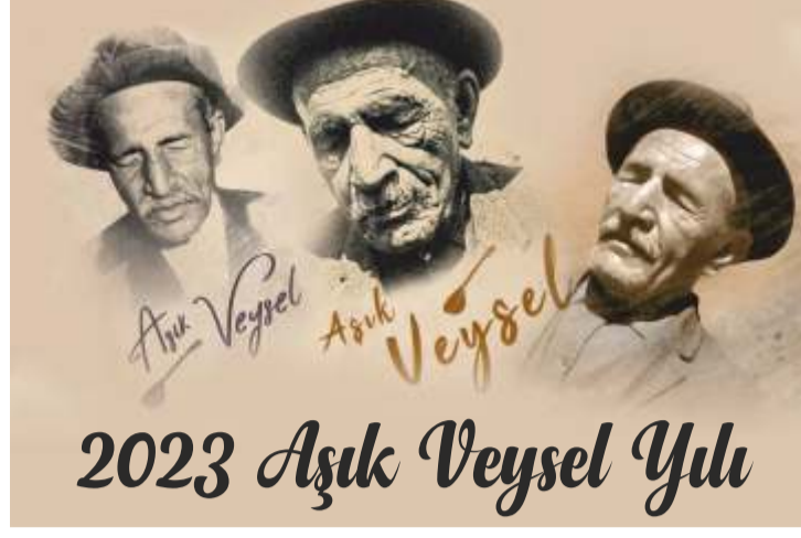
2023 Aşık Veysel Yılı