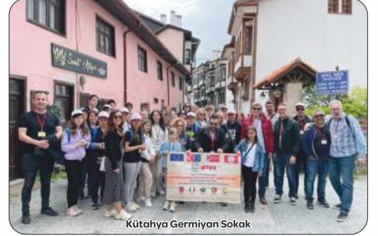
Kütahya Germiyan Sokak