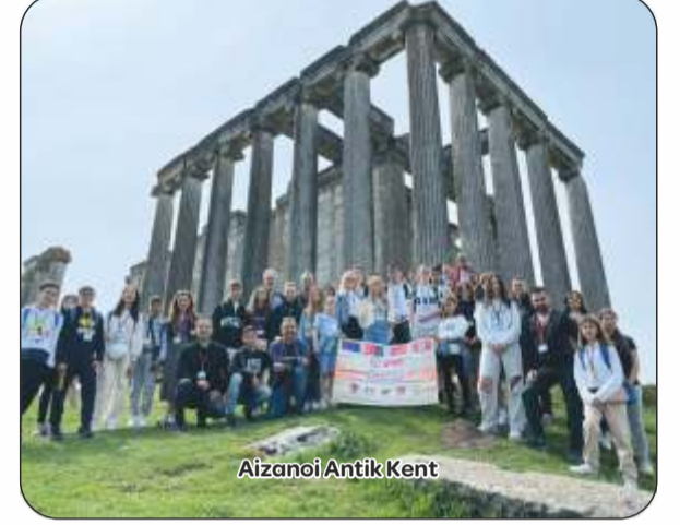
Aizanoi Antik Kent