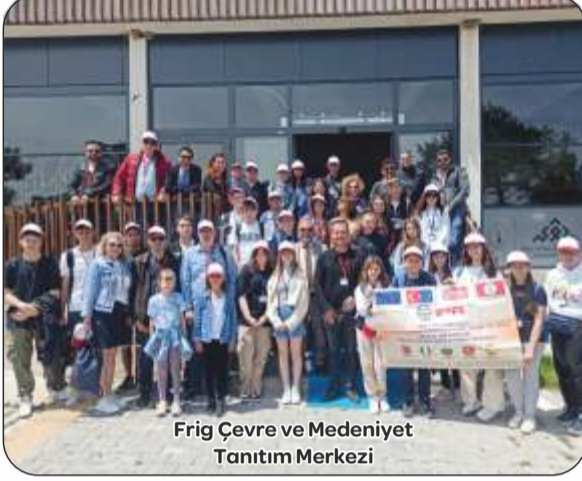
Frig Çevre ve Medeniyet Tanıtım Merkezi

hareketlilik kapsamında Robotik Kodlama, Arduino ile Kodlama, Arduino ile Elektrikli Devreler, Blok Kodlama ve C# programlama etkinlikleri yapıldı. Erasmus kapsamında okulumuzda bulunan misafirlerimize, okul tanıtım etkinlikleri, okulumuzun eğitim öğretim faaliyetleri, başarıları ve Türk eğitim sistemi hakkında bilgilendirme sunumları yapıldı. Protokol ziyaretlerinin yanı sıra misafirlerimizle Türk kültürünü tanıttı kültürel etkinlikler yapıldı. İlçemizin, ilimizin tarihi ve turistik yerleri ile Pamukkale'ye kültürel geziler düzenlendi.