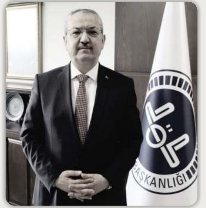
Hatay Muftüsü Merhum Ömer Faruk BİLGİLİ

Dünya çapında "Asrın Felaketi" olarak söz edilen depremde hayatını kaybeden Ömer Faruk Hocamıza ve tüm deprem şehitlerimize Allah'tan rahmet diler, kederli ailelerine ve geride kalanlara Allah'tan sabır niyaz ederiz. Rabbimizin bu tür felaketleri bir daha yaşatmamasını dileriz.